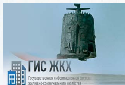
ГИС-Пепелац (стр. 21)