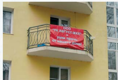
Попытка рейдерского захвата ТСН при поддержке жилинспекции (стр. 19)