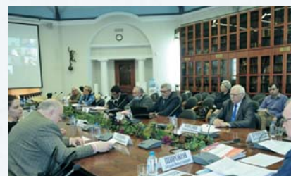
Конференция в ТПП (стр. 8.)